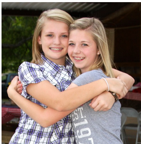
Aliente a los niños a formar una imagen corporal positiva.

impresiona mucho que tengas la fuerza suficiente para llevar esas bolsas" o "pareciera que ha mejorado la coordinación entre tus manos y tus ojos cuando juegas al básquetbol". La meta es valorar las funciones físicas por sobre su apariencia.